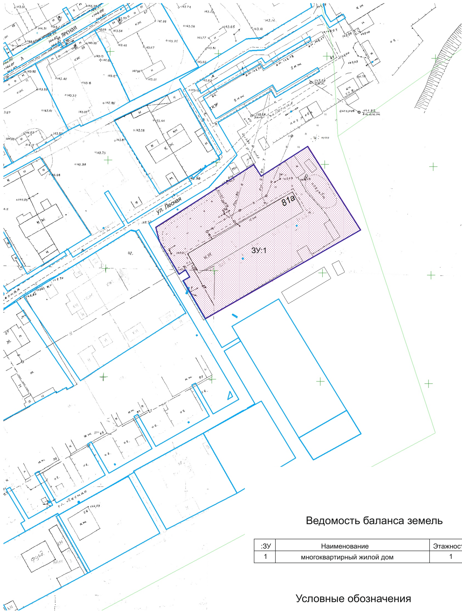
Ведомость баланса земель