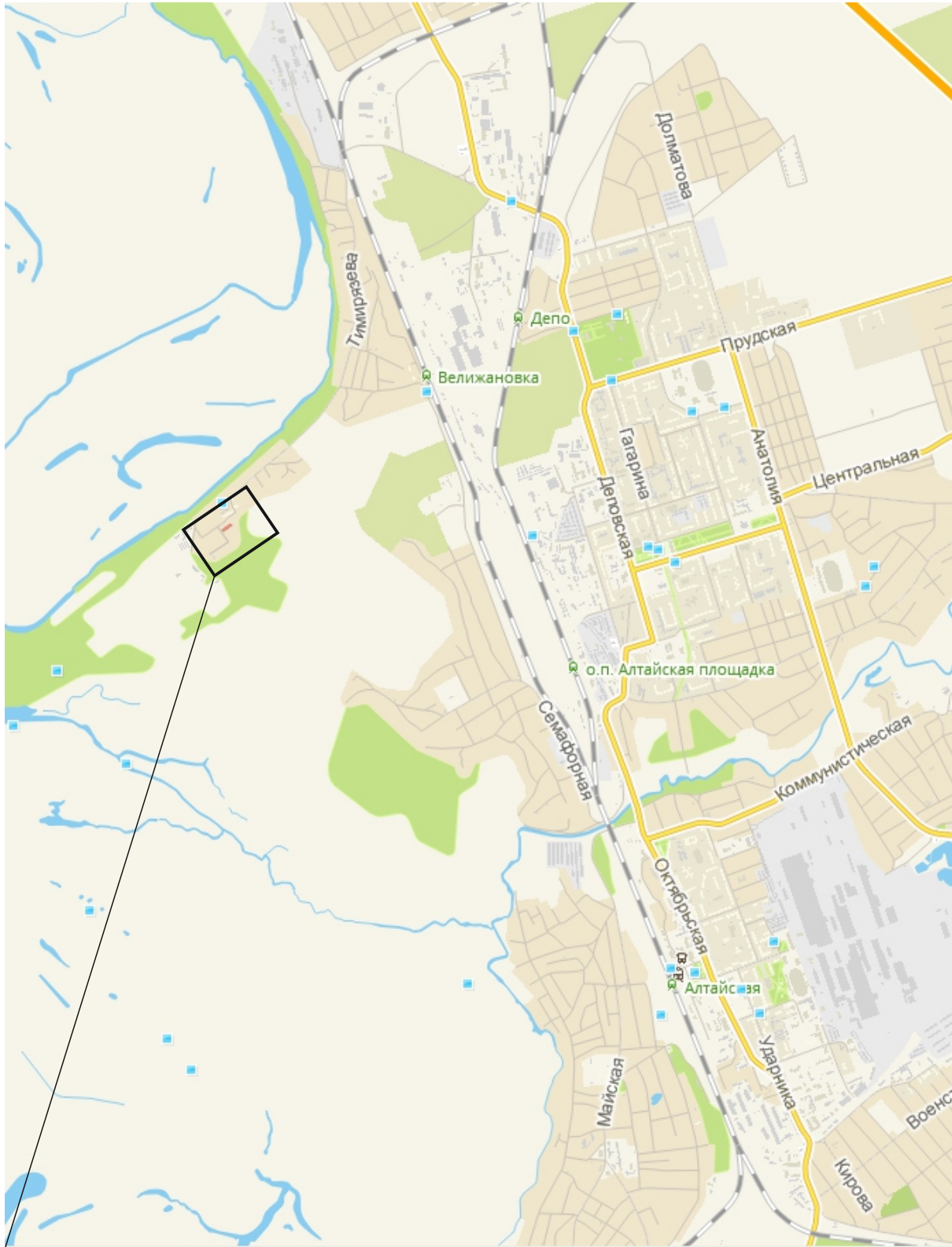
Территория межевания земельных участков